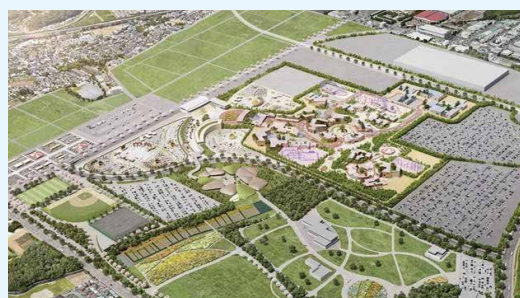
KAMISEYA PARK(仮称)イメージ図 横浜市記者会見発表資料より

大和をはじめとする近隣自治体と連携して、宿泊・観光施設・大学研究機関の誘致や交通インフラ整備を進めることでその可能性は広がります。