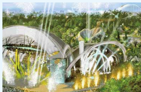
テーマパークゾーンのイメージ 横浜市記者会見発表資料より