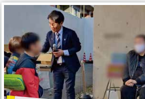
地域イベントに参加