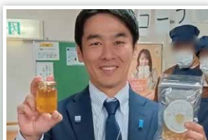
各地のイベント参加

また こう一郎に参加してほしい、意見を聞いてみたい、などございましたらお気軽にお問い合わせください!