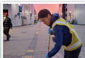
大和駅前の清掃活動